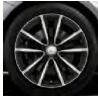
01R - cerchio in lega 18"