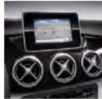
509 Becker Map Pilot

Assetto sportivo: comprende sterzo diretto e sospensioni selettive. Assetto si abbassa di 15mm (cod. 486)