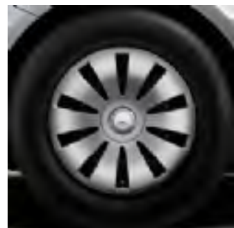
643 - cerchio comfort 16"