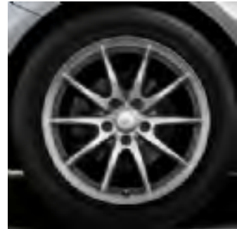
R43 cerchio in lega 17