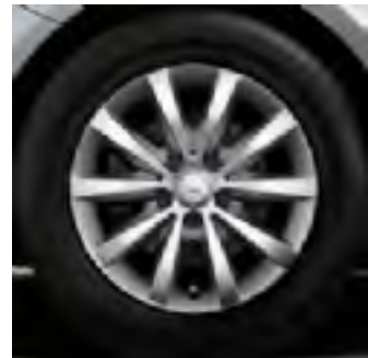
55R - cerchio in lega 16"