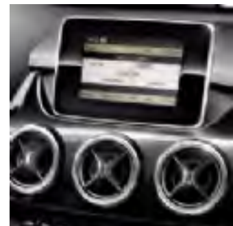
cod. 523 Audio 20CD

Audio 20 CD con lettore CD, tastiera telefonica e vivavoce Bluetooth integrato e lettore MP3 (cod. 523)