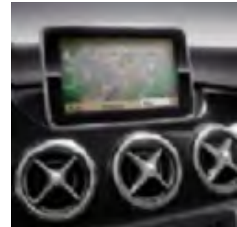
527 Comand OnLine