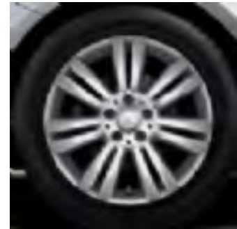
26R - cerchio in lega 17